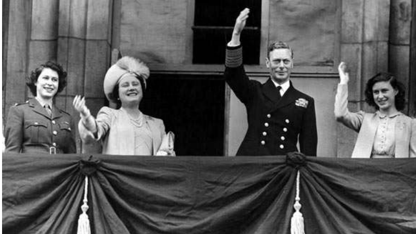
Vlnr. Prinses Elisabeth, Koningin Elisabeth, Koning George VI en Prinses Margaret