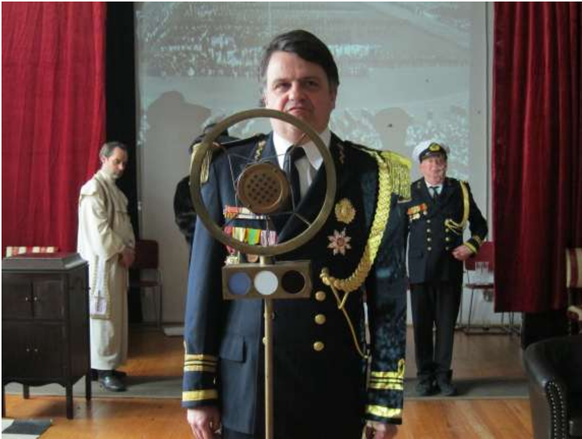
Vlnr Aartsbisschop Cosmo Lang,, Prins Albert en Koning George V