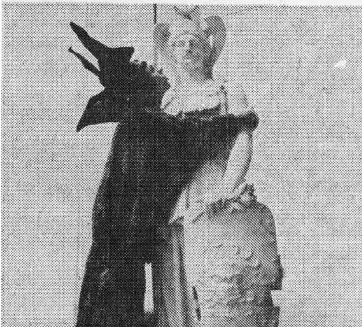
• Scène uit „Faust, visueel, fysikaal”. Faust omhelst zijn versteende schoonheidsideaal.

Het project „Faust, visueel, fysikaal” gaat donderdag in première en duurt tot en met zaterdag 27 juni. Het symposium, de lezing, begint steeds om 20.30 uur, het theatergedeelte steeds om 22.15 uur. Een en ander loopt door tot 24.00 uur. Reserveren kan via het Uitburo. Er wordt zowel binnen als buiten gespeeld.