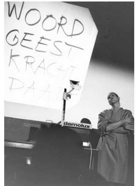
Woord, Geest, Kracht, Daad